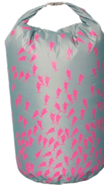
Kitchener Aarebag 2018, Modell Schwertfisch, CHF 29.90