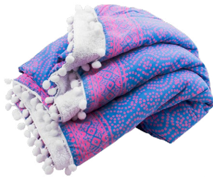
Linda Hering Badetuch Awan mit Frottee auf der Rückseite und Pompons, lindahering.ch , CHF 49.90