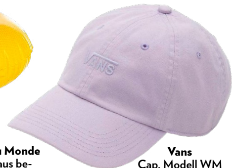
Vans Cap, Modell WM Court Side Hat, CHF 39.–