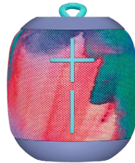
Ultimate Ears Kabelloser Lautsprecher Wonderboom Unicorn, CHF 119.–