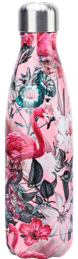
Chilly's Isolierflasche, hält Getränke bis zu 24 Stunden kalt, bei Manor, CHF 39.90