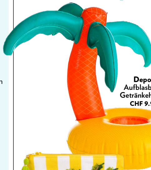
Depot Aufblasbarer Getränkehalter, CHF 9.95