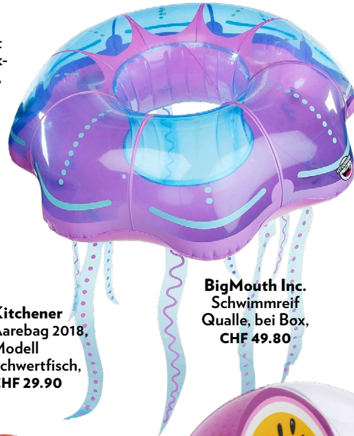
BigMouth Inc. Schwimmreif Qualle, bei Box, CHF 49.80