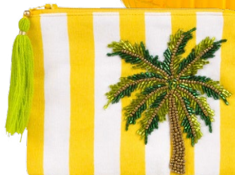
Maisons du Monde Täschchen aus bestickter Baumwolle, CHF 11.95